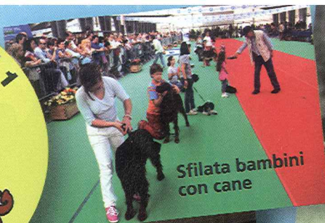
Sfilata bambini con cane